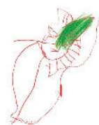
Nido d'Infanzia "Pinocchio"