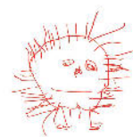
Nido d'Infanzia "Gramsci"