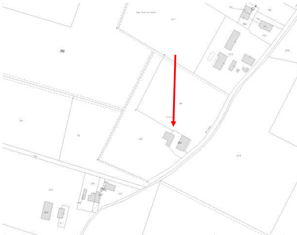
Estratto di mappa catastale