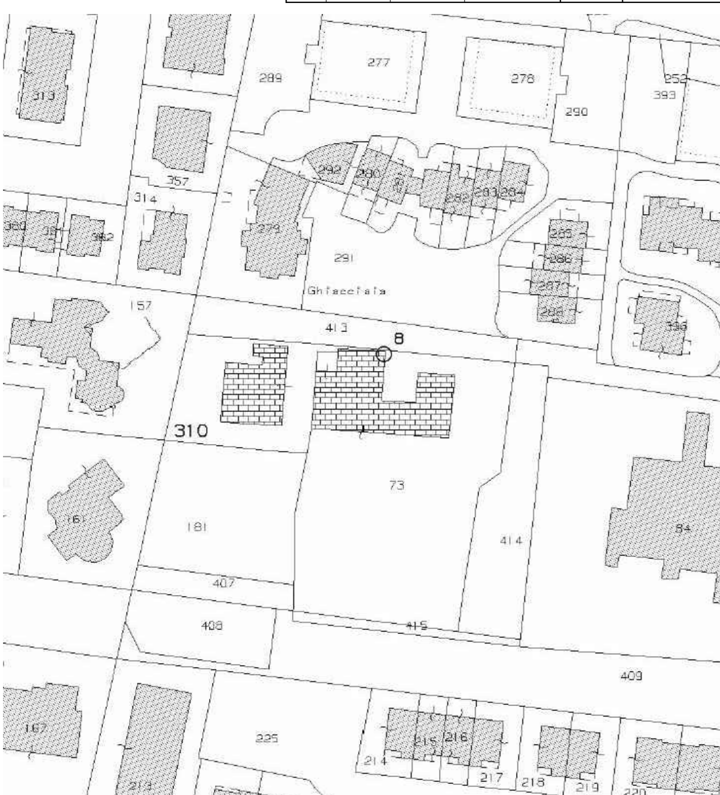
Estratto di mappa - Foglio 24