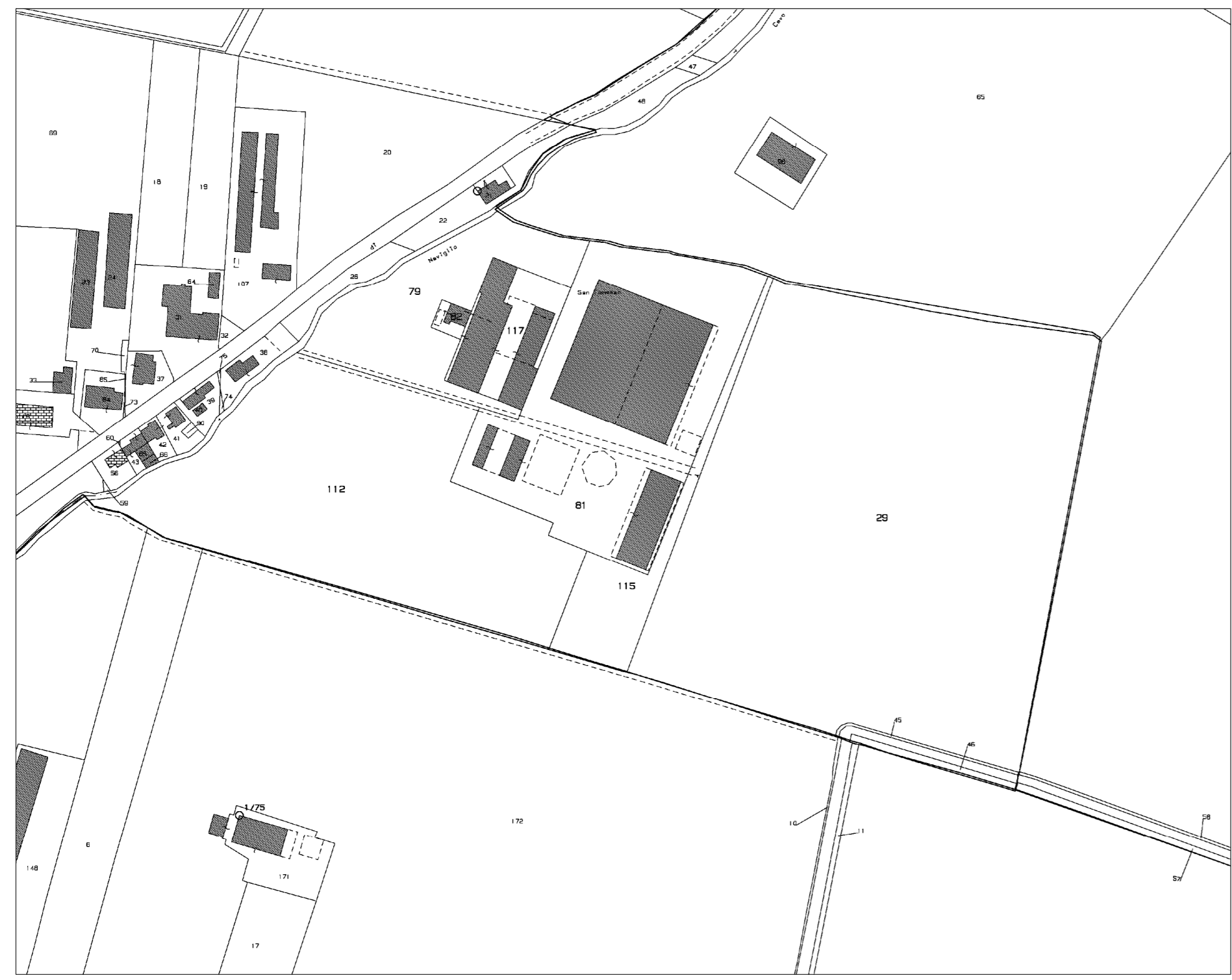
Estratto di mappa catastale - Scala 1:2000 Comune di Correggio - Foglio 70 e limitrofi