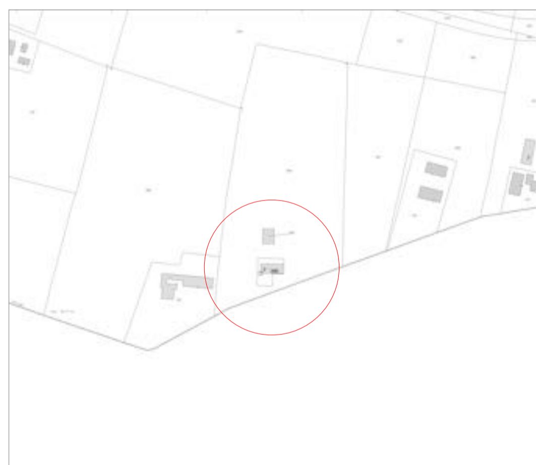
Estratto di mappa