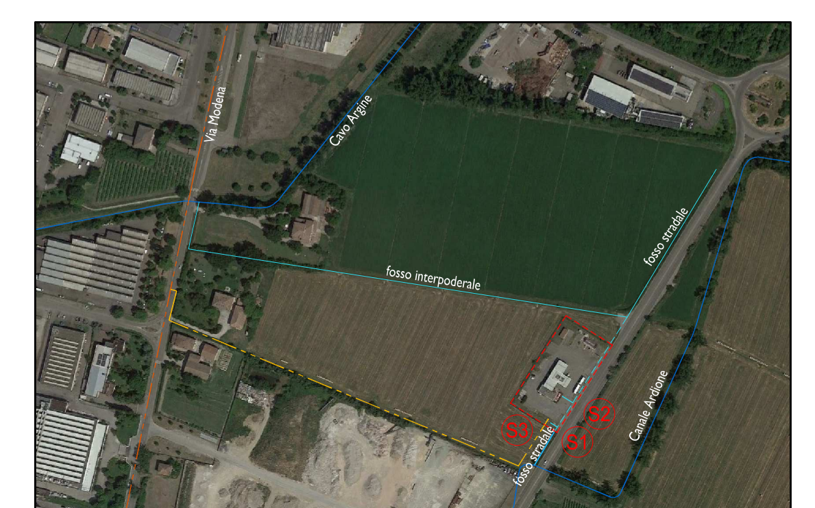
STATO DI FATTO: RETE FOGNARIA (SCALA 1:5.000)