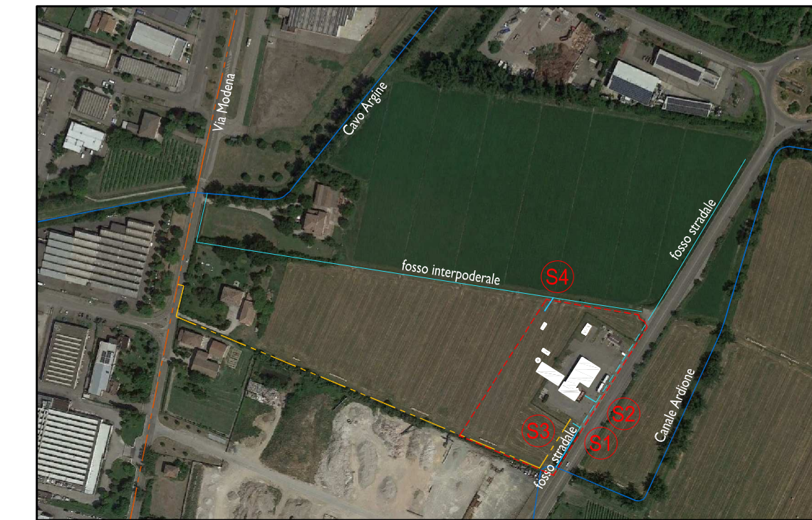
PROGETTO: RETE FOGNARIA (SCALA 1:5.000)