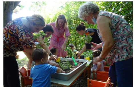
Nido La Mongolfiera