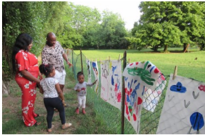
Scuola dell'infanzia Ghidoni Le Margherite