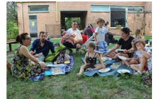
Scuola dell'infanzia Ghidoni Mandriolo