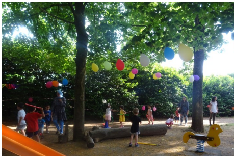
Scuola dell'infanzia Arcobaleno